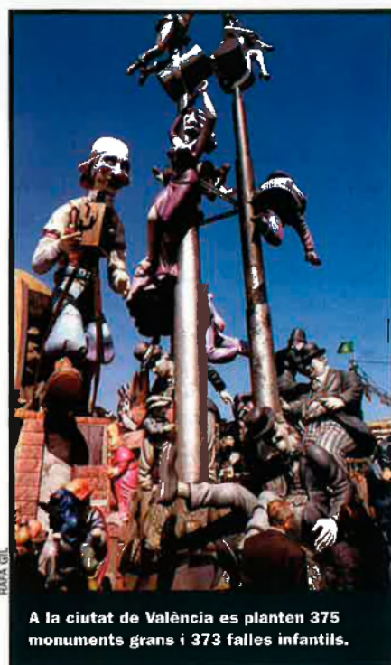
A la ciutat de València es planten 375 monuments grans i 373 falles infantils.