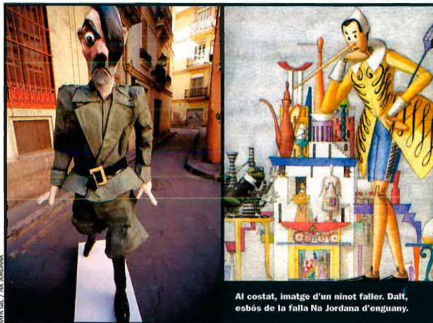
Al costat, imatge d'un ninot faller. Dalt, esbòs de la falla Na Jordana d'enguany.

un cadafal ple de pardals i pardalots. La Falla Vall de Laguar-Pare Ferris (b) és de la secció B, i Josep Puche n'és l'artífex.