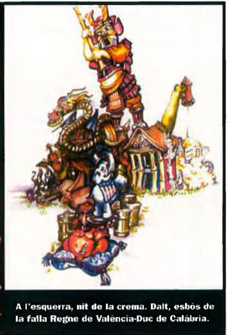
A l'esquerra, nit de la crema. Dalt, esbós de la falla Regne de València-Duc de Calàbria.