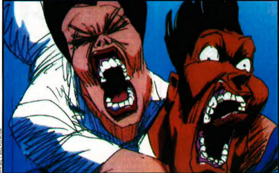
BACA GIL / BILL PLYMPTON

"Actualment, als Estats Units triomfa l'humor 'políticament incorrecte' i la comèdia grollera". Sèries com The Simpsons o South Park són filles del salvatge concepte dels dibuixos animats que és característic de Plympton. Amb ell, la irreverència domina al món de l'animació.