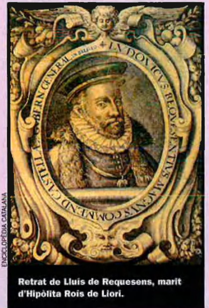
Retrat de Lluís de Requesens, marit d'Hipòlita Roís de Liori.

Hipòlita no sembla tenir cap pressa de viatjar a València per treure-la del monestir. Bo i al·legant la manca de seguretat a causa de la revolta de les Germanies, deixa passar el temps per veure si Beatriu canvia d'opinió i les monges, mentrestant, fan pres-