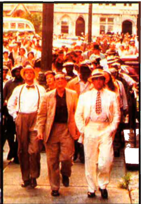
A l'esquerra, Orson Welles preparant una de les seves emissions radiofòniques. A la dreta imatge del film Abajo el telón , en el qual el director Tim Robbins descriu la societat americana dels anys trenta, incloent-hi un petit episodi de la vida d'Orson Welles.

l'episodi il·lustrat per Tim Robbins a Abajo el telón , i que va posar fi al Federal Theatre, però no a les prolífiques activitats de Welles durant la resta de la dècada. El jove prodigi del teatre d'avantguarda de Broadway va mantenir-se en actiu amb la seva companyia, el mític Mercury Theatre, on va reclutar una bona part dels actors que després havien de protagonitzar Ciudadà Kane i Els magnífics Ambersons . Un altre muntatge teatral estrenat a Boston el 1939, Five Kings , contenia la llavor shakespeariana del film que, vint-i-cinc anys més tard, havia de rodar a Espa-