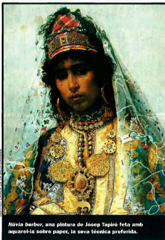
Núvia berber, una pintura de Josep Tapiró feta amb aquarel·la sobre paper, la seva tècnica preferida.

Els personatges reflectits pel pintor tenen noms i cognoms i trenquen amb els seus estereotips de l'orientalisme convencional. Mercè a l'impuls de Fortuny i Tapiró, aquest corrent cultural es desprèn dels excessos il·lusoris, per bé que no dels desitjos socials d'evasió. En l'obra del segon, les descripcions són tan estrictes i acurades que semblen respondre a un afany de científisme.