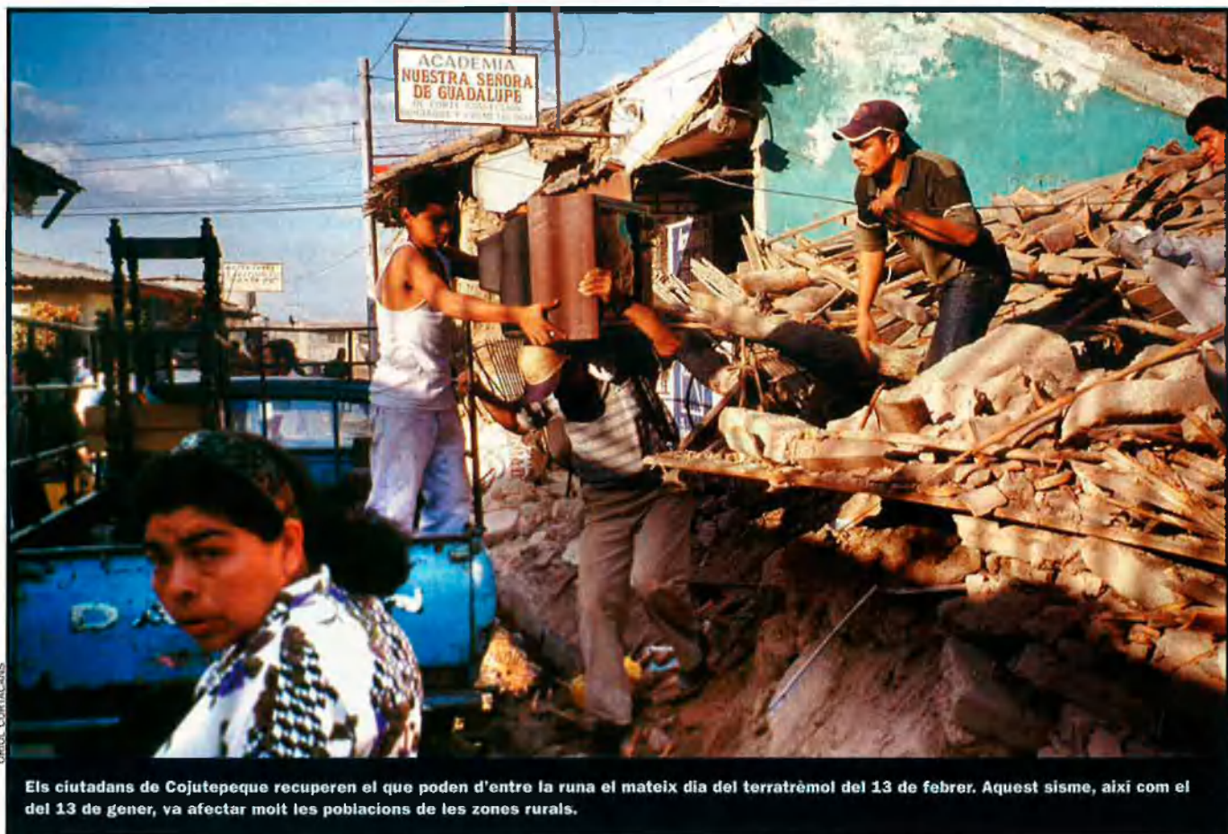
Els ciutadans de Cojutepeque recuperen el que poden d'entre la runa el mateix dia del terratrèmol del 13 de febrer. Aquest sisme, així com el del 13 de gener, va afectar molt les poblacions de les zones rurals.

ja tenim bons materials de construcció, però no podem comprar-los”.