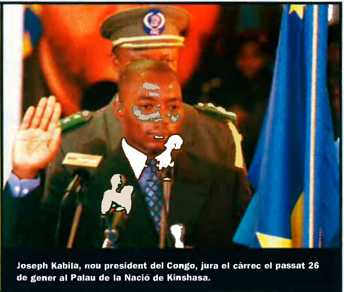
Joseph Kabila, nou president del Congo, jura el càrrec el passat 26 de gener al Palau de la Nació de Kinshasa.

Units per comparèixer davant el Consell de Seguretat de les Nacions Unides. En la seva intervenció, va assegurar que volia desbloquejar el procés de pau i va demanar que es fixés una data per al desplegament de 5.500 cascos blaus. El desplegament, votat l'any passat, no s'ha dut a terme perquè les Nacions Unides creuen que no hi ha garanties de seguretat per al contingent. Després del fracàs de Sierra Leone, una operació de dubtosa utilitat que costa milions de dòlars a les Nacions Unides i en què van morir desenes de cascos blaus, el secretari general, Kofi Annan, és reticent a emprendre la missió del Congo, si no es respecta l'alto-el-foc previst pels acords de Lusaka.