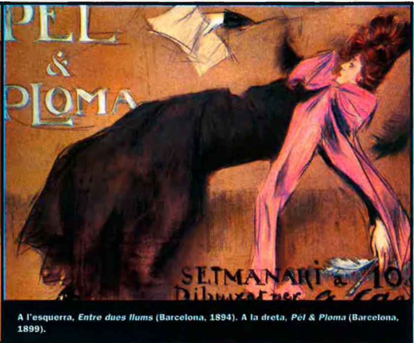
A l'esquerra, Entre dues llums (Barcelona, 1894). A la dreta, Pèl & Ploma (Barcelona, 1899).