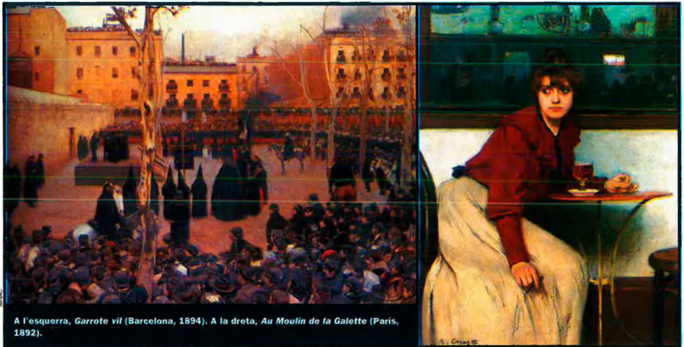
A l'esquerra, Garrote vil (Barcelona, 1894). A la dreta, Au Moulin de la Galette (Paris, 1892).