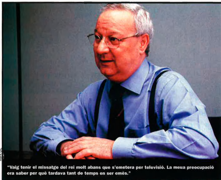
"Vaig tenir el missatge del rei molt abans que s'emetera per televisió. La meua preocupació era saber per què tardava tant de temps en ser emès."

També hi hagué qui començà a actuar, però amb uns objectius polítics ben di-