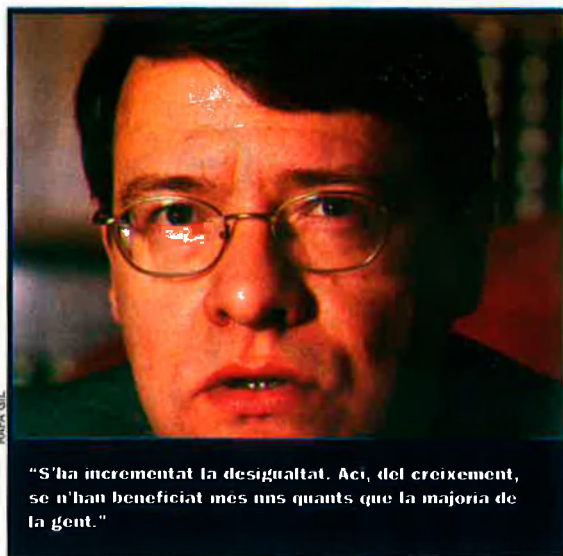
"S'ha incrementat la desigualtat. Ací, del creixement, se n'han beneficiat més uns quants que la majoria de la gent."

—En aquests moments, el primer problema que tenim al mercat laboral és la temporalitat i la precarietat. No hi ha cap raó perquè la taxa de temporalitat de l'estat espanyol siga pràcticament el triple que la mitjana de la UE, i no hi ha cap raó perquè dins d'aquesta temporalitat, el nivell de precarietat, de rotació de contractes, siga tan gran. I això s'ha d'abordar des de polítiques específiques per combatre aquesta temporalitat, amb propostes com les que estan fent els sindicats, com ara incrementar la cotització social dels contractes temporals, i, sobretot, que les lleis funcio-