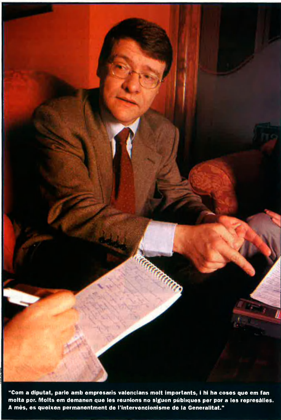
“Com a diputat, parle amb empresaris valencians molt importants, i hi ha coses que em fan molta por. Molts em demanen que les reunions no siguen públiques per por a les represalles. A més, es queixen permanentment de l'intervencionisme de la Generalitat.”

—Hi ha suficients indicis per suposar que la dimissió de Gisbert està vinculada a l'operació de fusió de Bancaixa i la CAM, la qual cosa planteja una primera pregunta. Si això és cert, Zaplana haurà d'explicar per què la Generalitat entra en el funcionament intern d'una caixa d'estalvis, fins al punt de determinar-ne qui és el director general. I si no és cert, haurà d'explicar-ho clarament. Aquest és un primer problema sobre el qual hem passat massa prompte. Tots hem do-