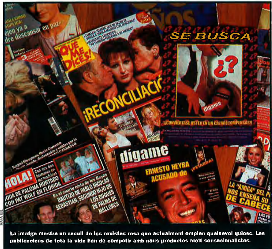
La imatge mostra un recull de les revistes rosa que actualment omplen qualsevol quiosc. Les publicacions de tota la vida han de competir amb nous productes molt sensacionalistes.

Els reporters del programa perseguïen els famosos càmera en mà i els mostrava en televisió, volgueren o no. Els presentadors se'n burlaven, i, en conseqüència, els espectadors també. Qué me