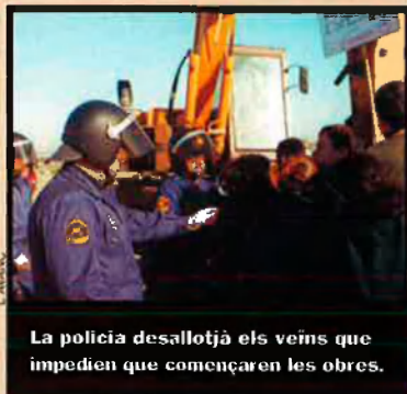
La policia desallotjà els veïns que impedièren que començaren les obres.

L'inici de les obres del quart cinturó de la ciutat de València a l'altura de Benimaclet va provocar una protesta que va acabar amb la intervenció de la policia. Les màquines havien començat a treballar, dijous 1 de febrer, quan un grup de veïns van encadenar-se fins que arribà la policia, que va desallotjar la protesta, amb una càrrega inclosa. Aquesta carretera, que unirà Benimaclet i Alboraià, discorrerà per terrenys on ara hi ha camps d'horta que desapareixeran.