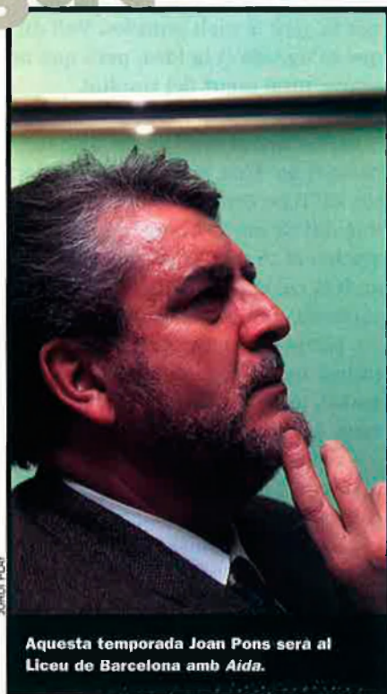
Aquesta temporada Joan Pons serà al Liceu de Barcelona amb Aida .