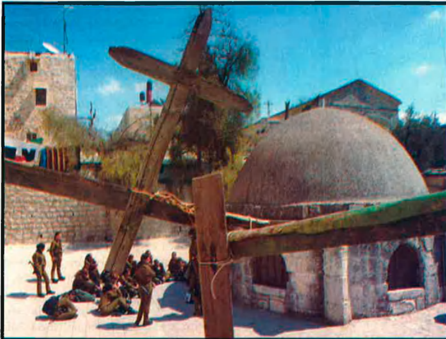
Durant la preparació de la visita del Papa Joan Pau II, soldats d'Israel envolten el Sant Sepulcre, situat en la Ciutat Vella de Jerusalem.

tes... Per tant, ha d'haver-hi un delicadíssim torn entre les diverses confessions cristianes. Passar un divendres sant al Sant Sepulcre és assistir a una veritable cursa de relleus entre cristians diversos i sovint enormement exòtics, mentre sents a fora com els muetjins criden a les oracions i com els jueus celebren l'entrada del sàbat. Però, a més, segons la tradició, a la muntanya del Gòlgota, on hi ha el Sant Sepulcre, hi ha el lloc on és enterrat també Adam. Recordem que en la iconografia cristiana sovint es pinta la creu on Jesús és crucificat damunt d'una calavera, que és al mateix temps el símbol del Gòlgota i el record d'Adam. Tanta significació per tan poca terra provoca un risc elevat de saturació. Fins al punt que alguns turistes pateixen la síndrome de Jerusalem, una variant mística i il·luminada de la síndrome de Stendhal que d'altres turistes pateixen a Florència.