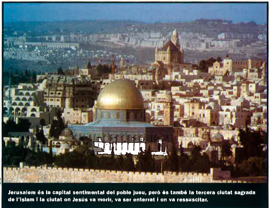
Jerusalem és la capital sentimental del poble jueu, però és també la tercera ciutat sagrada de l'islam i la ciutat on Jesús va morir, va ser enterrat i on va ressuscitar.