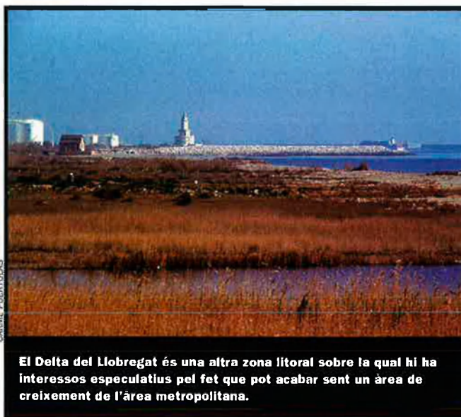
El Delta del Llobregat és una altra zona litoral sobre la qual hi ha interessos especulatius pel fet que pot acabar sent un àrea de creixement de l'àrea metropolitana.

Del Penedès a l'Ebre. Al Baix Penedès, la costa ja està pràcticament urbanitzada i només s'ha salvat, de moment, una zona d'aiguamolls coneguda com les Madrigueres i situada al litoral del terme del Vendrell. Aquesta és l'última zona humida que s'ha conservat en una comarca que antigament en tenia quinze i que l'agricultura o la urbanització turística han dessecat. La zona ha estat requalificada per construir-hi, però la pressió del Grup Ecologista del Vendrell i el Baix Penedès (GEVEN) ha aconseguit que només afecti la meitat de les 25 hectàrees dels aiguamolls. Els ecologistes, però, continuen pressionant per evi-