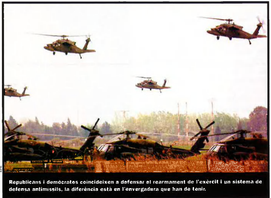
Republicans i demòcrates coincideixen a defensar el rearmament de l'exèrcit i un sistema de defensa antimíssils, la diferència està en l'envergadura que han de tenir.

Bush ha forjat la seva carrera política meteòrica amb el suport de la ultracristiandad, primer texana i després de tot el país. I no és que ell sigui un talibán de la puresa dels estats del sud, ja que en el balanç de la seva acció de govern hi surten guanyant els rics i amos de grans indústries més que no pas els vigilants de l'estricta moral kukluxklaniana . Això sí, mentre Bush va ser governador, aquest darrers van ser molt tinguts en compte a l'hora de fer discursos. Actes de contrició, pregàries, i conferències públiques eren freqüents al Texas de Bush. Per exemple, Molly Ivins, biògrafa crítica de Bush, recull una xerrada de l'ara president sobre la virtut de la castedat i la promoció entre els joves no verges d'assolir una "segona virginitat" a base de l'abstinència. Per acabar de convèncer els més fonamentalistes de la