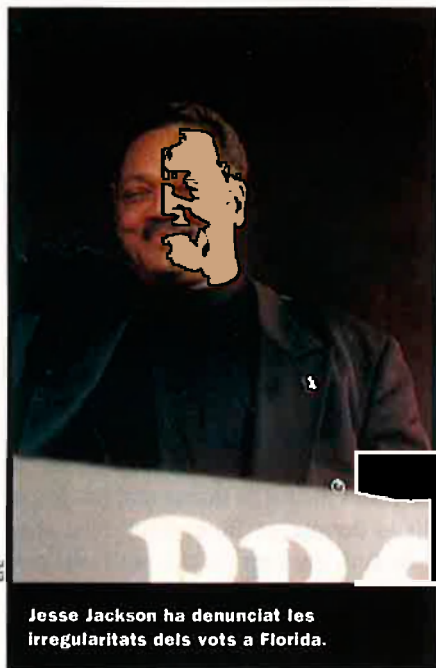
Jesse Jackson ha denunciat les irregularitats dels vots a Florida.

com la gran retallada d'impostos o la privatització de les pensions. Entre les primeres propostes legislatives, sempre que no hi sigui la reforma de McCain, hi haurà la reforma de l'educació, la declaració dels drets dels malalts, una primera retallada d'impostos modesta i la reforma del sistema de votació, aquesta darrera obligada després de l'espectacle de Florida.