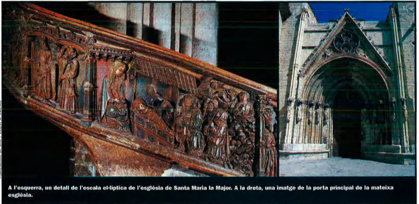
A l'esquerra, un detall de l'escala el·líptica de l'església de Santa Maria la Major. A la dreta, una imatge de la porta principal de la mateixa església.

altres maneres, encara que cal reconèixer que la sòbria arquitectura és el valor més preat que exhibeix. Jaume I, quan se la veié, també en quedà impressionat i en digué: "llogar que fa per nul hom del món, sinó del rei". El seu emplaçament, sobre un turó i coronat pel castell, és visible en el radi dilatat d'unes terres d'abrupta orografia, de "ports", barrancs i moles sobre cingles que fan ferredat. En la llunyania, Morella recorda i prou la talaia pètria de Montsegur, l'últim bastió de la resistència càtara. Pastors, artesans i perfectes càtars de l'alta Arieja, perseguits per la Inquisició, trobaren refugi en l'exili morellà. L'església de Santa Maria la Major mereix una serena visita, amb una escala el·líptica que duu al cor com no en trobareu cap en tot Europa. Després hi ha els petits palaus, com el del cardenal Ram, a hores d'ara un hotel encantador, l'ajuntament, d'un gòtic civil restaurat amb molt de trellat, i la plaça dels porxos, que és el melic de Morella. La ciutat ofereix la gastronomia consistent i els selectes embotits, propis d'una comarca d'oratge tan aspre com els horitzons retallats pels aterrossaments i les antigues línies de pedra dels "bovalars". La quallada i els flaons són l'herència dolça del domini de l'ovella, d'aquells ramats immensos organitzats dins del "Lligallo" —com la Mesta de Castella—