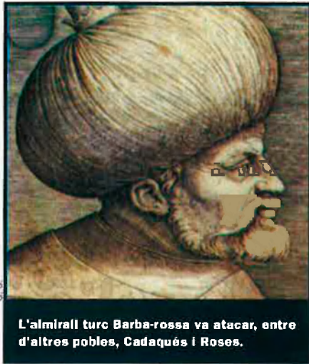
L'almirall turc Barba-rossa va atacar, entre d'altres pobles, Cadaqués i Roses.

La defensa en terra. Fins 1541 hi va haver un dur debat en el si de la monarquia. D'una banda, l'emperador i el seu almirall, el genovès Andrea Doria, pretenien una hegemonia absoluta en la Mediterrània basada en la superioritat de la seva flota enfront dels turcs i berberescos i una política agressiva en el nord d'Àfrica. Per contra, els regnes peninsulars eren menys ambiciosos i grandiloqüents i volien una defensa més propera al territori i uns objectius de conquesta més puntuals i de resultats més immediats, com era la petició constant de conquerir Alger, capital de Barba-rossa. La línia imperial va aconseguir alguns èxits, fonamentalment la conquesta de Tunis el 1535, però també fracassos espectaculars, com la derrota de Prevesa en 1538 i sobretot el desastre d'Alger de 1541. A partir d'aquell mo-