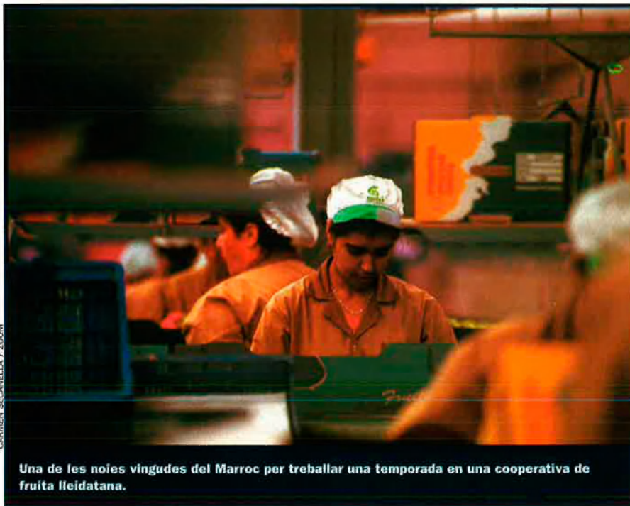
Una de les noies vingudes del Marroc per treballar una temporada en una cooperativa de fruita lleidatana.