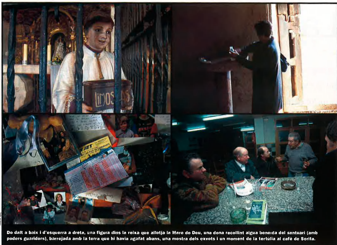
De dalt a baix i d'esquerra a dreta, una figura dins la reixa que allotja la Mare de Déu, una dona recollint aigua beneïda del santuari (amb poders gunridders), barrejada amb la terra que hi havia agafat abans, una mostra dels exvots i un moment de la tertúlia al cafè de Sorita.

cridar: "Pels ulls no, que es tornarà cega! Pels peus, per les mans, pels peus! Per la punta dels dits! Que ixquen els dimonis pels peus!".