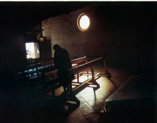
A l'esquerra, una escena dels anys vint, dins el santuari. Hi podem veure l'endimoniada de la Codonyera envoltada de tres caspolines i espectadors, davant l'altar. A la dreta, una imatge actual. Malgrat els efectes visuals, és difícil trobar-hi cap dimoni.