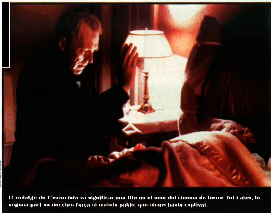
El rodatge de L'exorcista va significar una fita en el món del cinema de terror. Tot i això, la segona part va descobrir força el maliciós públic, que abans havia captivat.

Satanàs, Belzebug, Lucifer o Anticrist, tant se val com es digui, el diable sempre ha estat una figura llaminera per al cinema. Més enllà d'una prosaica personificació del mal, el dimoni encarna tot de temptacions i de plaers inimaginables. 'Posseïts' i la reestrena de 'L'exorcista' tornen a obrir la caixa dels trons.