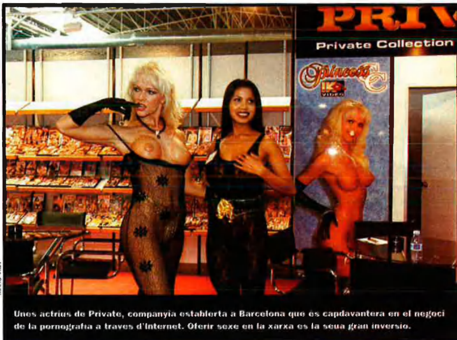
Unes actrius de Private, companyia establerta a Barcelona que és capdavantera en el negoci de la pornografia a través d'Internet. Oferir sexe en la xarxa és la seua gran inversió.

Un 'Gran Hermano' del sexe. No només Garrido i la seua empresa tenen de tot. Arreu d'Internet, l'oferta de mercaderia visual relacionada amb el sexe és aclaparadora, en totes les vessants imaginables. L'última moda que mana al ciberespai és la de les webcams o càmeres web, és a dir, webs a través de les quals el navegant pot accedir en directe a les escenes que recull una càmera electrònica. L'usuari contempla, previ pagament, escenes sexuals quotidianes protagonitzades per gent "normal", per gent tan anònima com ell mateix: és el triomf del voyeurisme . És la translació a l'electrònica de l'ànima de les pel·lícules porno casolanes –protagonitzades per aficionats– a les quals ha fet referència Pablo Garrido. És també la translació a l'electrònica eròtica de la possibilitat d'observar obscenament individus mediocres que va explotar el programa te-