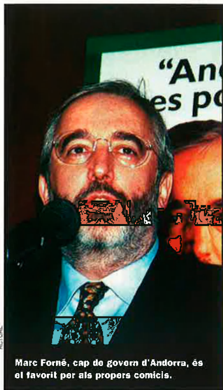
Marc Forné, cap de govern d'Andorra, és el favorit per als propers comicis.

rals. S'ha de veure si cristal·litzarà l'intent de coalició del PS i el PD per concórrer a les eleccions del març, i que sembla l'única via amb possibilitats reals de desallotjar els liberals del poder, tenint en compte que en les eleccions comunals del 1999 aquests van rebre, en el conjunt del país, un sever revés propinat per persones que avui militen al PS i al PD. Però cal dir també que una cohabitació PS-PD en el poder presentaria moltes incògnites quant a la seva estabilitat futura, ja que la seva formació hauria obeït molt més al desig d'abatre l'adversari comú que no pas a concommitàncies ideològiques ni en molts casos personals, en un país on, políticament, les persones i el clientelisme dels