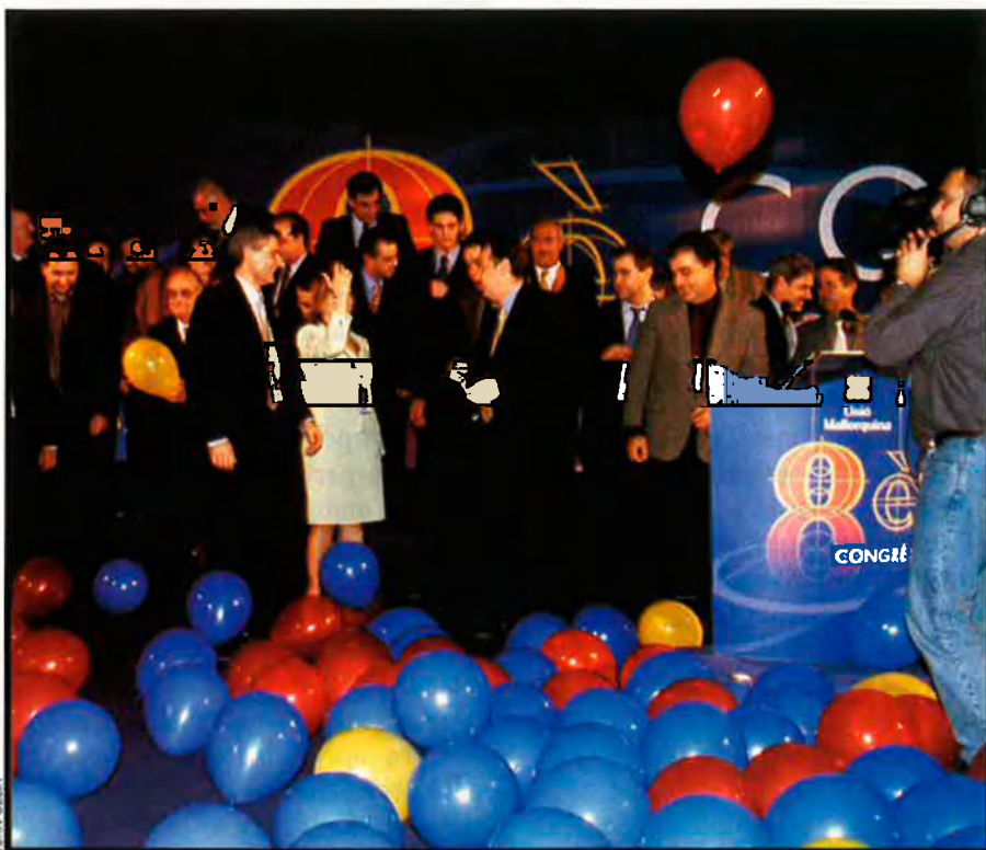
El congrés d'Unió Mallorquina va ser espectacular, amb una escenografia molt estudiada. A la fi, centenars de globus van inundar l'escenari del Conservatori de Música de Palma.