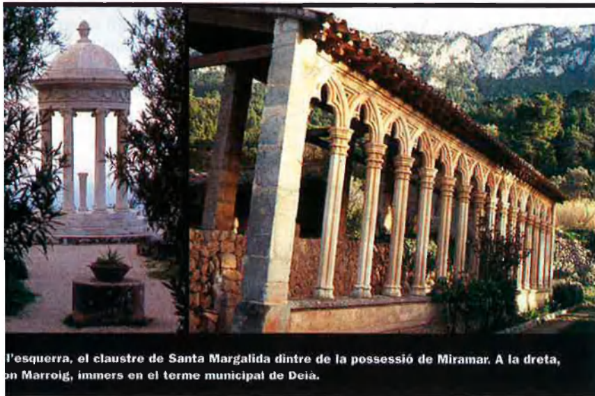
A l'esquerra, el claustre de Santa Margalida dintre de la possessió de Miramar. A la dreta, el claustre de Son Marroig, immers en el terme municipal de Deià.