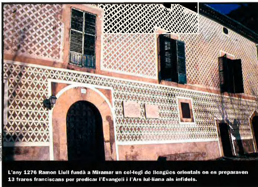
L'any 1276 Ramon Llull fundà a Miramar un col·legi de llengües orientals on es preparaven 13 frares franciscans per predicar l'Evangeli i l'Ars lul·liana als infidels.

S i encara no coneixeu la relació de l'arxiduc Lluís Salvador amb Mallorca, us pot servir com a carta de presentació el testimoni de Santiago Rusinol: "Va privar que en tot el seu terme es pogués tallar una branca, i el bosc, agraït, va ufanar-se en vestir-se de gran ger i científic curiós i enciclopèdic, és l'autor del monumental Die Balearen , la més important monografia que s'ha escrit sobre les Balears. Fou propietari de gran part de les finques situades entre Valldemossa i Deià, a la costa nord de Mallorca. A Miramar, ressuscità el vell esperit del Blanquerna lul·lià.