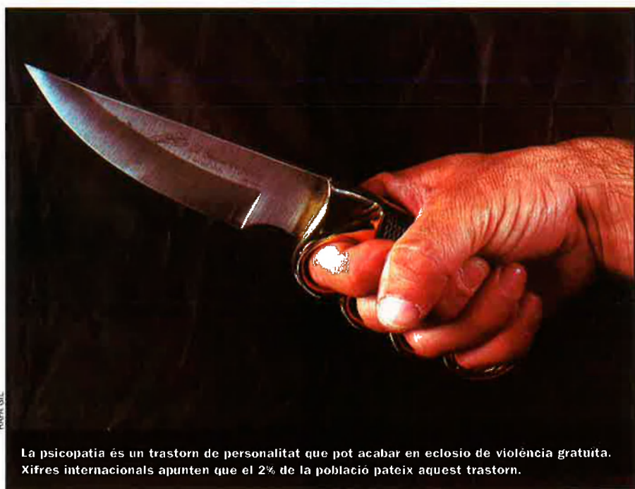
La psicopatia és un trastorn de personalitat que pot acabar en eclosió de violència gratuïta. Xifres internacionals apunten que el 2% de la població pateix aquest trastorn.

Sense el fre social i psicològic, i predisposició psicopàtica, atada als mitjans de comunicació, té el terreny adobat per concretar-se."