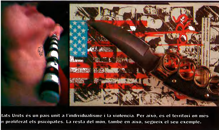
Estats Units es un país unit a l'individualisme i la violència. Per això, és el territori on més s'ha proliferat els psicòpates. La resta del món, també en això, segueix el seu exemple.

se control. No obstant això, l'incapacitat dels conceptes vitals despietats de la dècada dels 80, i la possibilitat d'observar en mitjans de comunicació fenòmens de violència psicopàtica que, des d'aquella dècada, es dona al nostre país, ha influït en molts dels actes delictius