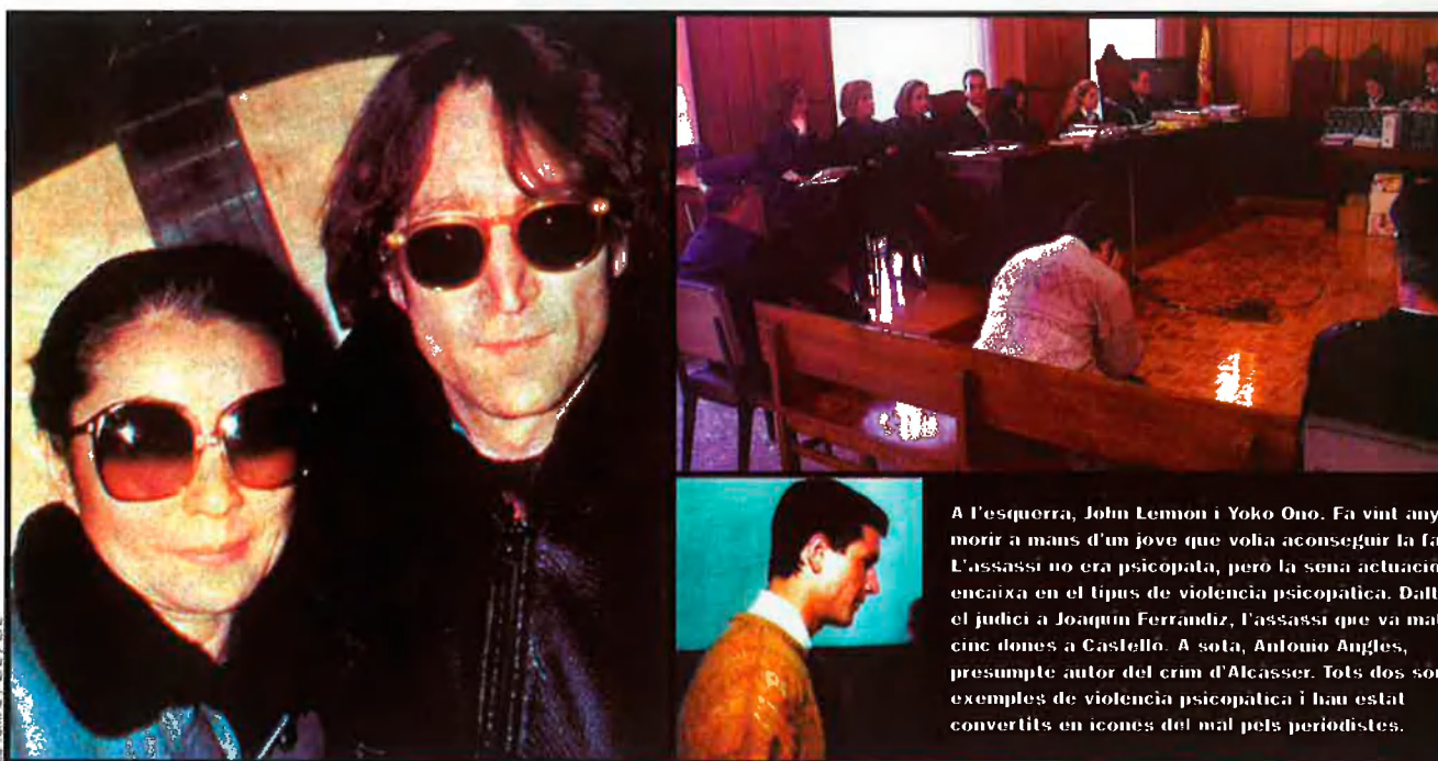
A l'esquerra, John Lennon i Yoko Ono. Fa vint anys morir a mans d'un jove que volia aconseguir la fama. L'assassí no era psicopata, però la seua actuació encaixa en el tipus de violència psicopàtica. Dalt, el judici a Joaquín Ferrándiz, l'assassí que va matar cinc dones a Castelló. A sota, Antonio Anglés, presumpte autor del crim d'Alcàsser. Tots dos són exemples de violència psicopàtica i han estat convertits en icones del mal pels periodistes.

Per això, en casos determinats, reixen explosions de violència. Si el còpata no és capaç de trobar un altre de l'avorriments dins de la legalitat, possible que atenga fantasies que li pliguen de poder i de satisfacció e