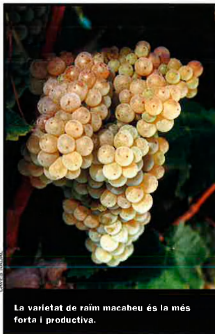
La varietat de raïm macabeu és la més forta i productiva.

El que conserva la mateixa importància i misteri de sempre és la composició del xarop o licor d'expedició, generalment elaborat amb vins envellits o brandis i altres productes naturals i sucre, amb una fórmula que cada cavista se'n guardarà prou d'explicar, i que es transmet de generació en generació, se li acaba de donar a cada xampany la seva dolçor adequada i el toc personal de cada elaborador. El contingut de sucre final en defineix la categoria.