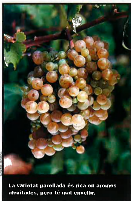
La varietat parellada és rica en aromes afruitades, però té mal envellir.

Alguna vegada s'han autoritzat, esporàdicament i a títol experimental, caves d'altres varietats, sempre amb raïm de qualitat inqüestionable i per caves d'alt nivell, però sense que ho posés a l'etiqueta. És cert, però, que aquí, de xampany se n'ha fet tota la vida, o quasi, amb les varietats tradicionals, i es fan productes excel·lents, amb personalitat i amb un potencial comercial que fa que, en quantitat d'ampolles a tot el món, que no en import de facturació, anem pel davant de l'abans omnipotent cham-pagne francès.