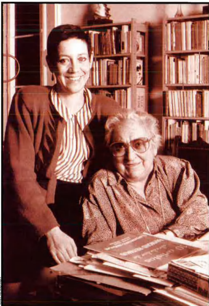
Montserrat Roig i Maria Aurèlia Capmany, al pis de la plaça Reial, l'any 1991.