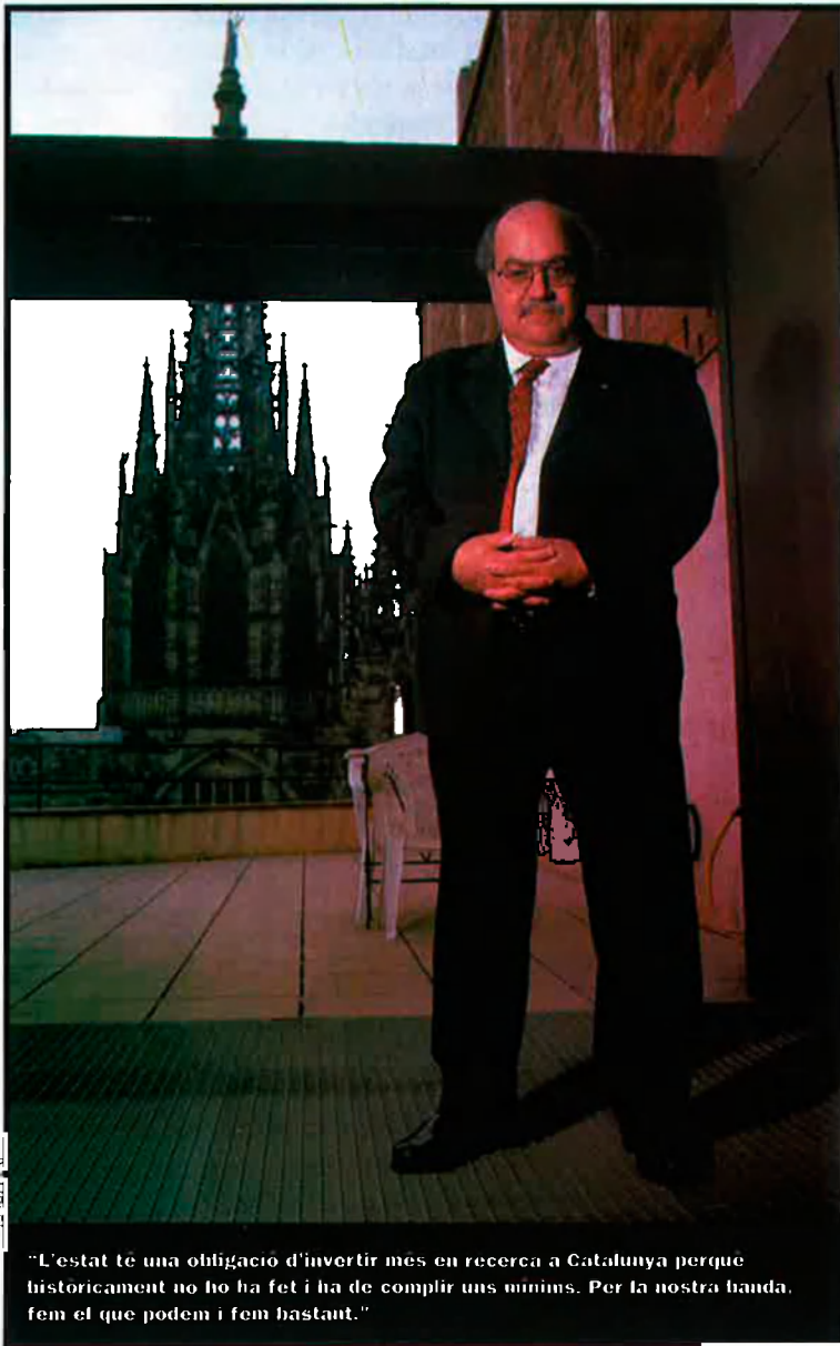
"L'estat té una obligació d'invertir més en recerca a Catalunya perquè històricament no ho ha fet i ha de complir uns mínims. Per la nostra banda, fem el que podem i fem bastant."

—No. Ha de ser ja. Per dues raons. D'una banda, perquè volem estar preparats per quan estiguin transferides. Volem que es noti el canvi de gestió i, per tant, volem preparar-nos. D'altra