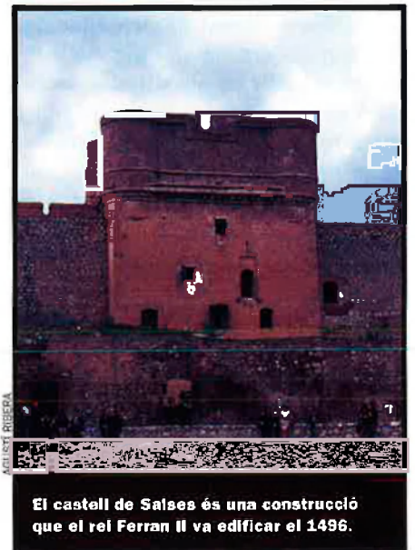
El castell de Salses és una construcció que el rei Ferran II va edificar el 1496.

Roses, Cadaqués i de Cotlliure i les ciutats fortificades de Perpinyà i Puigcerdà. Però va ser a peu de la serra de les Corberes, la frontera natural durant molts segles on més castells fronterers s'hi van concentrar.