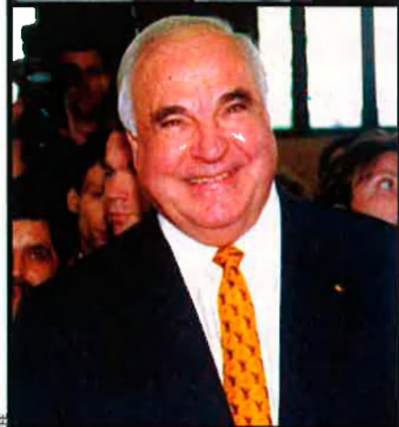
Dalt, Erich Honecker, que va ser obligat a dimitir com a president de l'RDA. A sota, Helmut Kohl, artífex de la reunificació.

de repetir victòria, encara que per un marge molt més reduït.