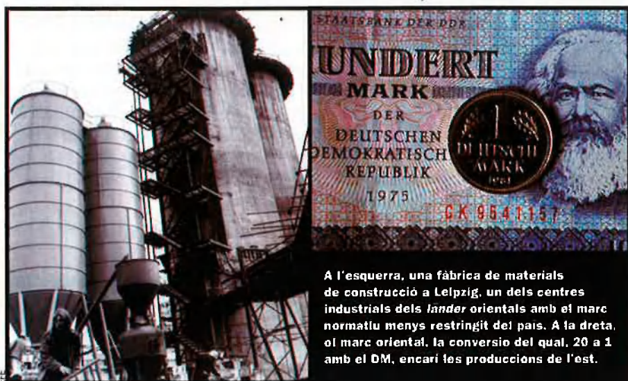
A l'esquerra, una fàbrica de construcció a Leipzig, un dels centres industrials dels lander orientals amb el marc normaliu menys restringit del país. A la dreta, el marc oriental, la conversió del qual, 20 a 1 amb el DM, encara les produccions de l'est.

Un altre dels fenòmens que juga en favor del desenvolupament de l'economia de l'ex-RDA és la futura ampliació de la Unió Europea cap a l'est. Els nous lander podran beneficiar-se especialment de la incorporació de Polònia i de la República Txeca a la UE. A més, les institucions europees també inverteixen importants quantitats en la construcció d'infraestructures que enllacin l'actual territori de la Unió amb el dels futurs membres. Es tracta de projectes, com l'autopista de Berlín a Varsòvia, que travessaran parcialment el territori de l'Alemanya de l'Est. La renovació del paisatge urbà de Berlín ha estat impressionant aquests darrers deu anys. De la ciutat dividida d'abans de la caiguda del mur, ja no en resten sinó records. El districte central de Berlín, que s'estén aproximadament des de la columna del Friedensengel, a l'oest, fins a l'Alexanderplatz, a l'est, s'ha transformat completament. On abans s'alçaven el mur i les torres de vigilància s'aixequen avui