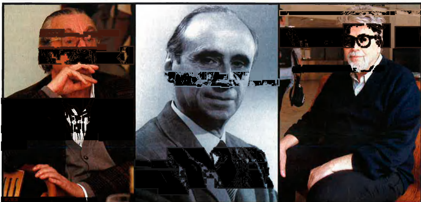
A l'esquerra, l'assagista Joan Fuster; al centre, l'historiador Ferran Soldevila; i, a la dreta, el sociòleg Josep Vicent Marquès.

De l'exili i el retorn. Una altra obra, no menys important, són els dietaris de Ferran Soldevila. Tres i Quatre acaba d'editar el segon i darrer volum, centrat en l'exili i retorn de l'escriptor. Aquesta obra titulada concretament Dietaris de l'exili i el retorn , es basa sobretot en les anotacions que Soldevila va prendre