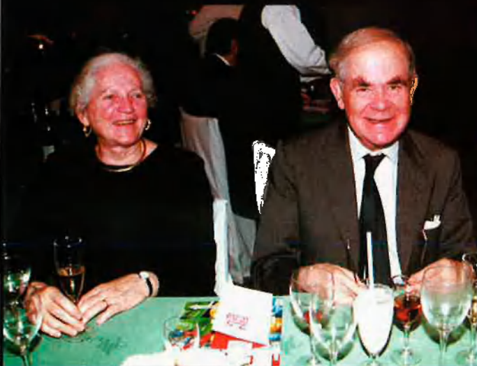
El filòleg i escriptor angles Jocelyn Hillgarth, amb clares mostres d'entusiasme.