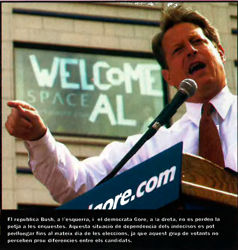
El republicà Bush, a l'esquerra, i el demòcrata Gore, a la dreta, no es perden la petja a les enquestes. Aquesta situació de dependència dels indecisos es pot perllongar fins al mateix dia de les eleccions, ja que aquest grup de votants no perceben prou diferències entre els candidats.

verd de vot perdut, ja que no només és segur que no serà president, sinó que agafant vots demòcrates pot fer que el nou amo de la Casa Blanca sigui un republicà contrari precisament a totes les idees de Nader.