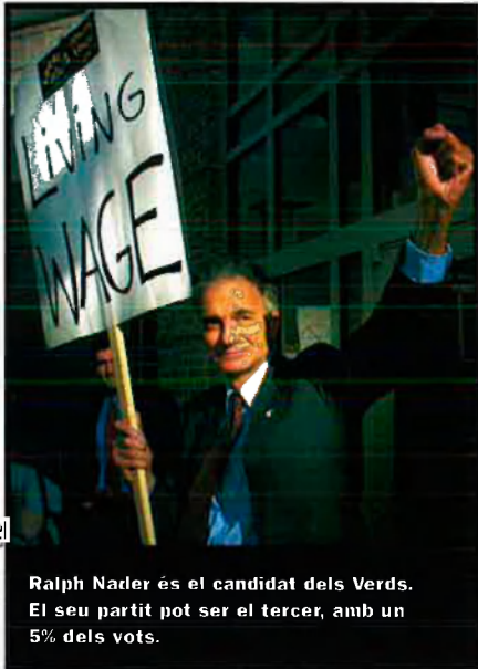
Ralph Nader és el candidat dels Verds. El seu partit pot ser el tercer, amb un 5% dels vots.

en els darrers comicis presidencials, només va votar un 49% de la població en edat de fer-ho (en la majoria de països europeus aquesta xifra passa del 60%). La participació en aquest tipus d'eleccions ja havia anat caient des dels anys seixanta, però no havia estat tan baixa des de 1924.