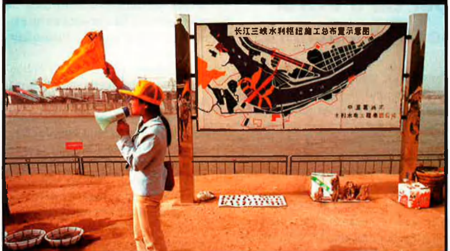
En menys de sis anys, el pressupost de l'obra s'ha duplicat i actualment és de gairebé cinc bilions de pessetes. En la imatge, un detall del plànol de la presa.