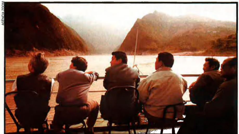
Hi ha el temor que la corrupció deixi com a herència una construcció defectuosa en un moment en què se succeeixen els incidents relacionats amb les grans obres.

Des del nomenament de Zhu Rongji com a primer ministre al març de 1998, els casos de corrupció comencen a sortir a la llum. Es calcula que al voltant de 10.500 milions de pessetes del pressupost de 1999 destinat a les poblacions riberenques han desaparegut. Comencen a caure algunes sancions. Després d'una visita d'inspecció del cap de govern a finals de 1998, més d'un centenar de dirigents van ser substituïts. Un funcionari del cantó de Fengdú va ser condemnat a mort. A començament de