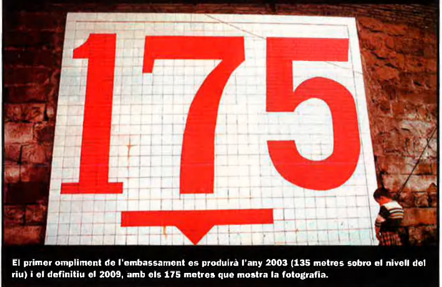
El primer ompliment de l'embassament es produirà l'any 2003 (135 metres sobre el nivell del riu) i el definitiu el 2009, amb els 175 metres que mostra la fotografia.