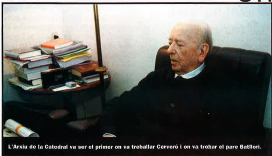
L'Arxiu de la Catedral va ser el primer on va treballar Cerveró i on va trobar el pare Batllori.

Els Borja són, sens dubte, el puntal més important de les investigacions de Lluís Cerveró. La seua connexió amb el pare Batllori va ser fonamental per a les seues recerques. EL TEMPS ha volgut conèixer les claus d'aquella col·laboració i aquestes són les confidències de l'eminent investigador català.