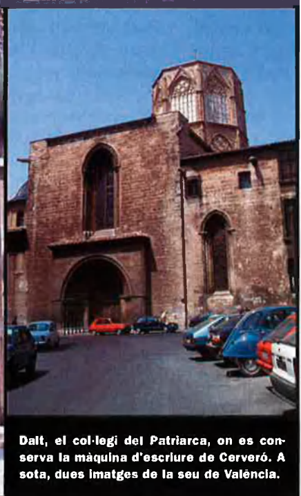
Dalt, el col·legi del Patriarca, on es conserva la màquina d’esclure de Cerveró. A sota, dues imatges de la seu de València.