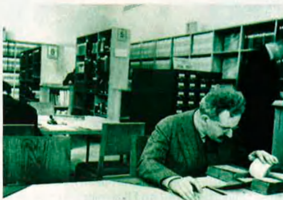
Walter Benjamin donarà nom a una societat internacional que vol tenir el centre a Portbou.

Els organitzadors de la conferència l'han projectada sota el lema "Passar fronteres" perquè "traspasant lliurement les fronteres de les disciplines, Benjamin va crear una imatge de l'era moderna que conserva encara tot el poder de fascinació. Per exemple, el seu 'àngel de la història' no és únicament una metàfora que ha de ser entesa en el marc del seu moment històric, sinó una imatge que exigeix i possibilita interpretacions sempre vives segons l'actualitat, i que conservarà aquesta potència associativa per a generacions futures". Ll. B.