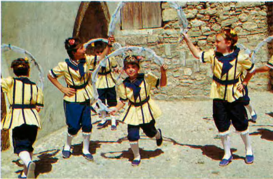
Dalt, a l'esquerra, el Ball de les Gitanetes. A sota, dansa d'Arts i Oficis.

Un Sexenni més car. Actualment, l'estalvi ja no caracteritza el Sexenni. Les festes comencen el dia 17 amb l'entrada de les colònies (la Morellano-catalana i la dels Morellans Absents, que reuneix tota la resta, inclosos els que viuen a Castelló o a València) i continua el divendres 18 amb la romeria que surt de Morella per anar a buscar la Mare de Déu al santuari de Vallivana, mentre els veïns fan la "plantada" dels car-