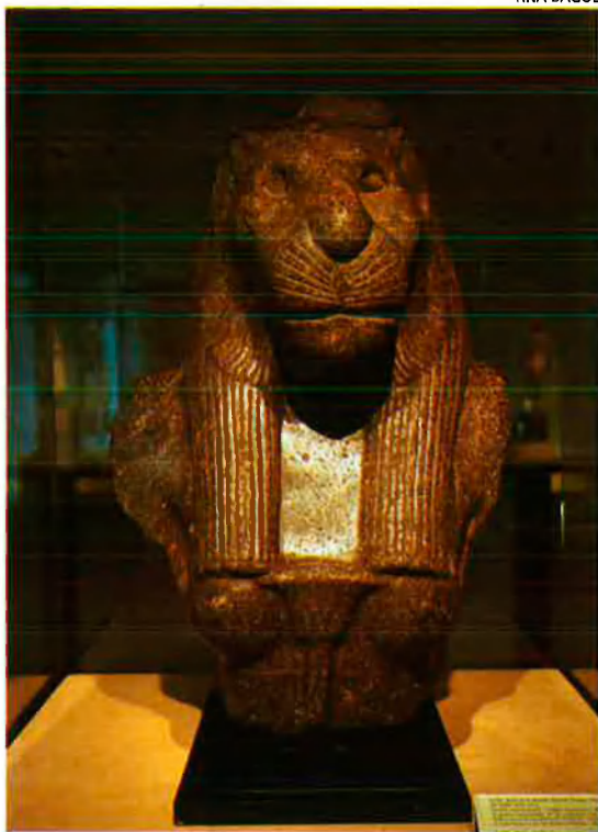
Bust de la deessa Sacmis, de la Dinastia XVIII (regnat d'Amenofis III, 1391-1353 aC). Sacmis representava l'energia destructora del déu Ra, el seu pare. A sota, sarcòfag i mòmia coberta amb una xarxa de denes, de fusta i pasta vidriada (Baixa Època, 715-332 aC). Els egipcis es referien al sarcòfag com "el Senyor de la Vida".

Baix Egipte (de color vermell), o una combinació de totes dues: l'elm blau de guerra i el nemes , o lligadura de tela amb franges.