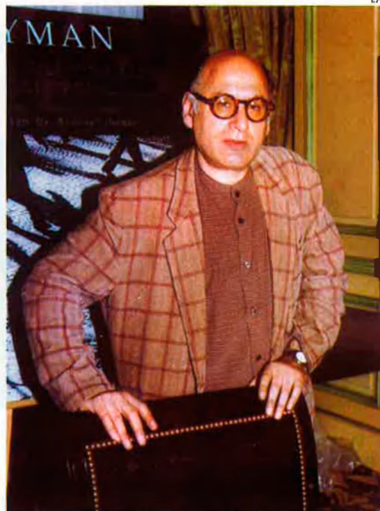
Michael Nyman interpretarà a Peralada 'Facing Goya'. Portada a escena per Mario Gas.

Finalment, un altra cita tradicional de l'estiu del Principat és el Festival Internacional de Música de Cantonigròs, que enguany s'escaurà els dies 13-16 de juliol. Per vint-i-tresena vegada s'hi tornaran a reunir formacions