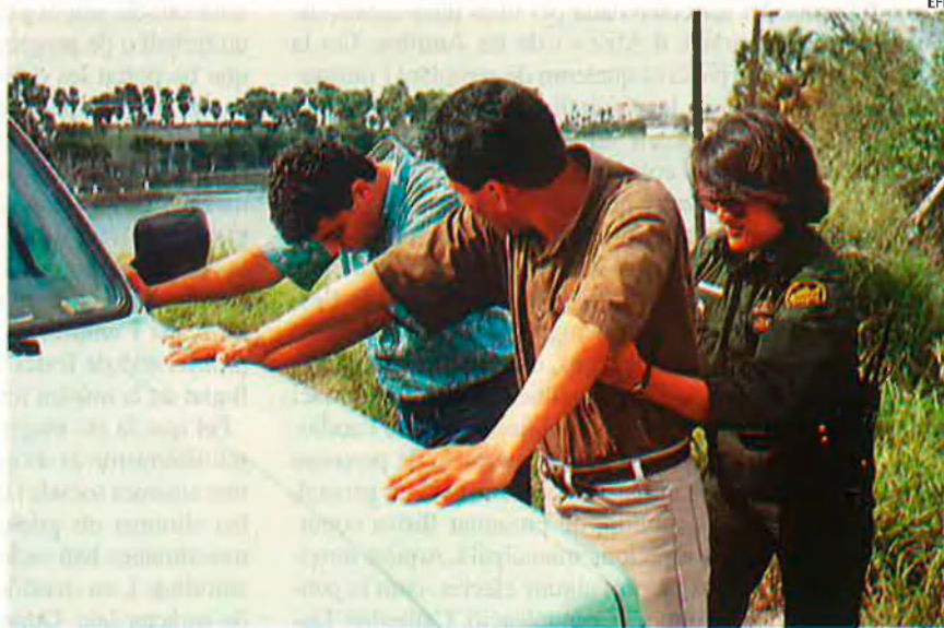
Uns mexicans són detinguts en creuar la frontera dels Estats Units, en imatge d'arxiu. L'època en què els nord-americans temien per la supervivència de l'anglès ha passat.

Els Estats Units viuen un llarg període de creixement econòmic sostingut i, com en el cas de l'Europa occidental, el país rep una allau d'immigrants. En els últims deu anys es calcula que han entrat als EUA uns deu milions de persones, la major part llatins o hispans, és a dir, procedents de Centramèrica i Sud-amèrica. També són nombrosos els asiàtics. Si el 1970 el nombre d'immigrants representava el 5% de la població, avui dia són el 10%, és a dir, uns trenta milions de persones. En el cas de Califòrnia, fins a una quarta part de la població ha nascut a l'estranger. És la conseqüència del desenvolupament que comporta la nova economia, la sorgida de les noves tecnologies.