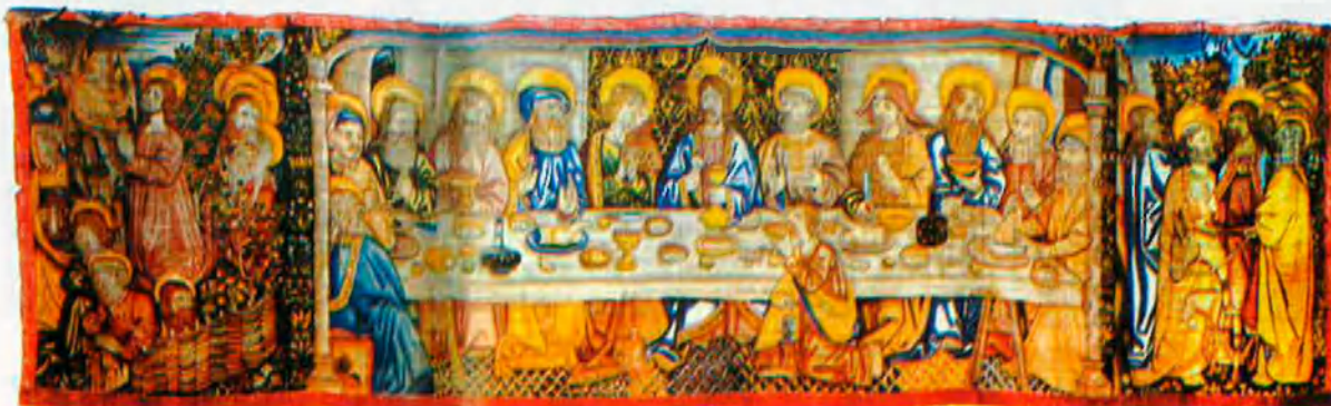
ARKIU / BISBAT DE TORTOSA

A l'esquerra, creu processional de la parròquia de Sant Mateu realitzada als tallers de la població a finals del segle XIV. A sota, el 'Tapís del Sant Sopar', de la catedral de Tortosa, que data del segle XV. Està elaborat amb lli, llanes, seda i or.