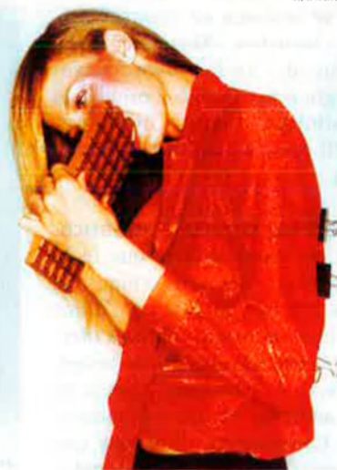
'Hungry?' (1995). És una de les imatges de la mostra "Look at me".

repassa aquesta exposició itinerant organitzada pel British Council. Aquest macroprograma es complementa amb nombroses activitats paral·leles, com ara cursos, debats, conferències i tallers. La informació completa de la Primavera també està disponible a través d'Internet ( http://cultura.gencat.es/casm ) i ( www.artplus.es/primaverafotografia ).