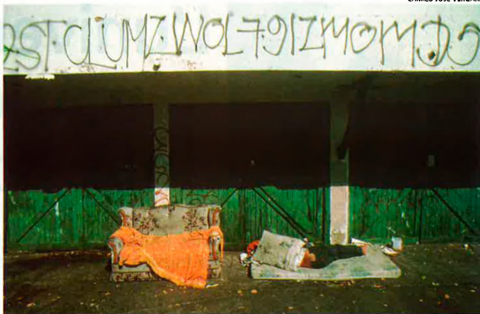
CAMILO JOSÉ VERGARA

Més reflexions. Com la que fa el col·lectiu a la mostra "Mirades impúdiques" (Centre Cultural de la Fundació La Caixa de Barcelona, del 12 d'abril al 25 de juny). El tema d'estudi, els límits entre l'àmbit públic i el privat. Artistes contemporanis de diferents països com Estats Units, Japó, Canadà, Sud-àfrica, Espanya..., participen en aquest projecte que, a través del vici d'observar, analitza la relació entre la mirada de l'artista i la realitat que reflecteix. Un home que juga a golf a la seva habitació o un altre que s'està assegut al sofà del seu menjador són dos exemples per parlar d'un temps, aquest, en què s'amagen situacions com la solitud, la vellesa o la mort. Entre els dotze artistes que hi participen, dotze formes d'entendre el món, hi ha el vídeo de Nuria Canal. Moltes vegades molt , el seu títol, se centra en la conversa íntima d'un grup de dones.