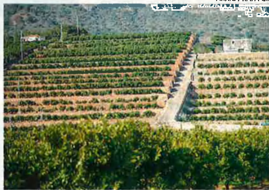
Camp de taronges en una muntanya. El sistema de reg localitzat ha permès que la taronja envaesca terrenys fins fa poc temps erms.

la UE a les exportacions de fruites i hortalisses marroquines [450.000 tones de cítrics l'any segons l'acord d'associació signat entre aquest país i la UE] no han comportat un risc excessiu de desestabilització dels