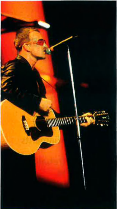
Bono, líder del grup U2. La formació irlandesa ha estat una de les protagonistes del pop dels vuitanta i noranta.

que l'existència de l'MP3 abarateixi el cost final del suport, el compacte o qualsevol que pugui aparèixer amb el temps. Les grans multinacionals no han reaccionat a temps i encara no han trobat un mitjà prou eficaç per a frenar l'expansió d'aquesta pirateria musical. La solució és difícil, si tenim en compte que l'MP3 és un format legal, i que només un ús esbiaixat el faria entrar dins la il·legalitat.