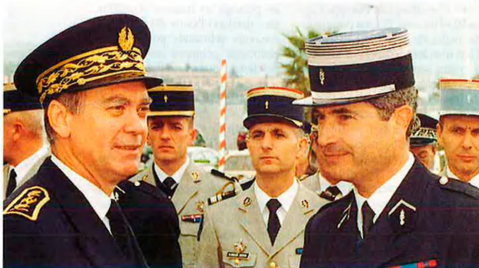
L'ex-prefecte de Catalunya Nord, Bernard Bonnet, a l'esquerra, va ocupar el mateix càrrec a Còrsega. Després d'uns atemptats a quioscos de platja va ser acusat de terrorisme d'estat.

3. Nacionalistes. Les seves reivindicacions es resumeixen en una plataforma de quinze punts amb vista a "un acord polític amb l'estat francès". Les més destacades són el reconeixement del poble cors (legalment només hi ha el poble francès), dotar l'illa de poders executius, legislatius i judicials, llibertat per a organitzar la seva administració, la seva fiscalitat i la seva política econòmica, social i cultural. També demanen l'oficialització de la llengua corsa, la creació d'un sistema educatiu propi i una política laboral que afavoreixi el retorn dels milers de corsos dispersos pel món. Igualment, parlen d'un programa polític per etapes que tingui en compte el dret a l'autodeterminació i que permeti de desenvolupar relacions internacionals. Finalment, reivindiquen l'amnistia de tots els patriotes "empresonats, buscats i perseguits". Aquesta plataforma ha estat elaborada per vuit dels tretze moviments nacionalistes operatius i és defensada pels diputats de la coalició nacionalista Corsica Nazione. A. R.