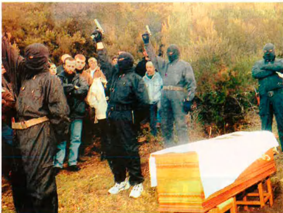
Members del grup armat FLNC-històric, el més important de l'illa. Ells, juntament amb cinc grups armats més, van declarar un alto-el-foc sense condicions el passat 23 de desembre.

Aquestes dades indiquen que aquests últims trenta anys s'han anat estenent, fins a esdevenir majoritàries, algunes de les idees bàsiques del nacionalisme cors. En