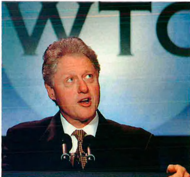
El president dels EUA, Bill Clinton, en una sessió de la cimera de l'OMC el passat 1 de desembre a Seattle.

(Corea i Alemanya) que van ser dividits per una guerra. El tros que es va tancar i es va socialitzar (Corea del Nord i l'Alemanya de l'Est) es va empobrir miserablement i mai no van ser un exemple de llibertat democràtica. El tros que es va "globalitzar" i "liberalitzar" (Corea del Sud i la República Federal d'Alemanya) va prosperar i va introduir la democràcia. Alemanya i Corea són el més semblant que els economistes mai ens trobarem a un experiment de laboratori. I els resultats en són d'allò més clars.