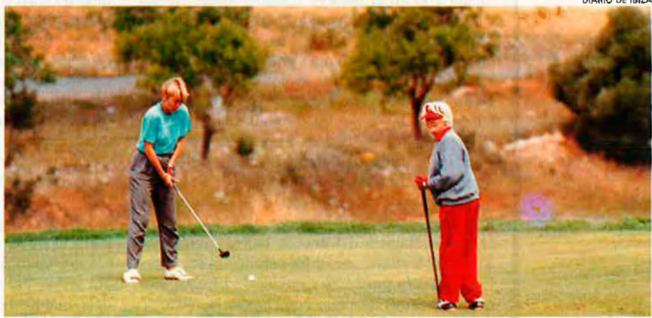
La paralització de les obres a Cala d'Hort (dalt), va ser el primer pas de la moratòria que ha aprovat el Consell. La pràctica del golf (sota) no està pensada per a l'ecosistema mediterrani.