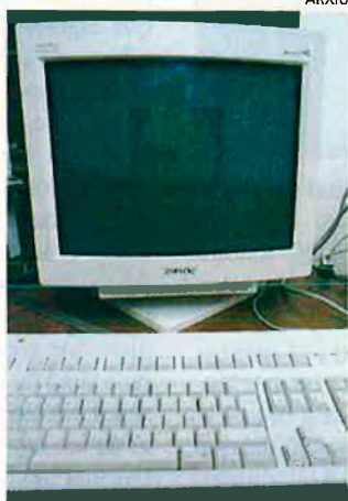
Els ordinadors personal seran els protagonistes de la revolució musical del segle XXI.

possibilitat per als fans d'aquests artistes. En les darreries del segle XX s'està dissenyant com serà la música el proper mil·lenni amb l'ordinador com a eina que pot substituir els equips musicals convencionals. Si els reproductors personals de MP3 en pocs anys costaran menys diners que els de CD-Rom i fins i tot que els mateixos walkmans, l'any 2000 les empreses discogràfiques i certs artistes com els Bestie Boys apostaran per les noves tecnologies. Precisament aquest