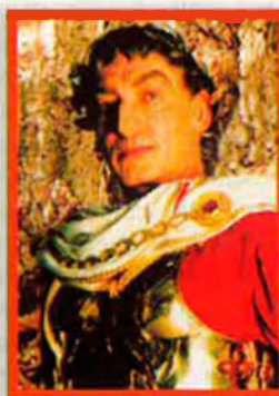
Gottfried John en el paper de Cèsar