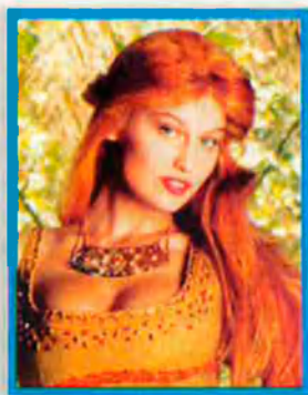
Laëtitia Casta interpreta Falbala