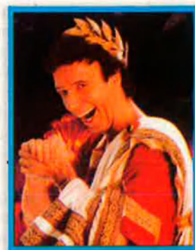
Roberto Benigni interpreta Detritus