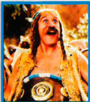
Gérard Depardieu en el paper d' Obélix